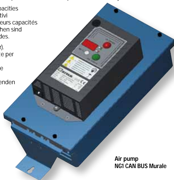
Air pump NG1 CAN BUS Murale

Every model is available for air lift batteries (please, allocate the correct code in the Purchase Order). Tutti i modelli sono disponibili anche per batterie a ricircolo d'aria (richiedere il codice corrispondente per compilare l'ordine d'acquisto correttamente). Tous les modèles sont disponibles aussi pour batterie avec brassage d'air (merci de demander le code correspondant pour rédiger l'Ordre d'Achat correctement). Jedes Gerät ist für Luftumwälzung lieferbar (bitte fragen Sie vor der Bestellung nach der entsprechenden Bestellnummer). Todos los modelos son también disponibles para baterías que llevan bomba de aire (preguntar por el código correspondiente para una cumplimentación correcta del pedido).